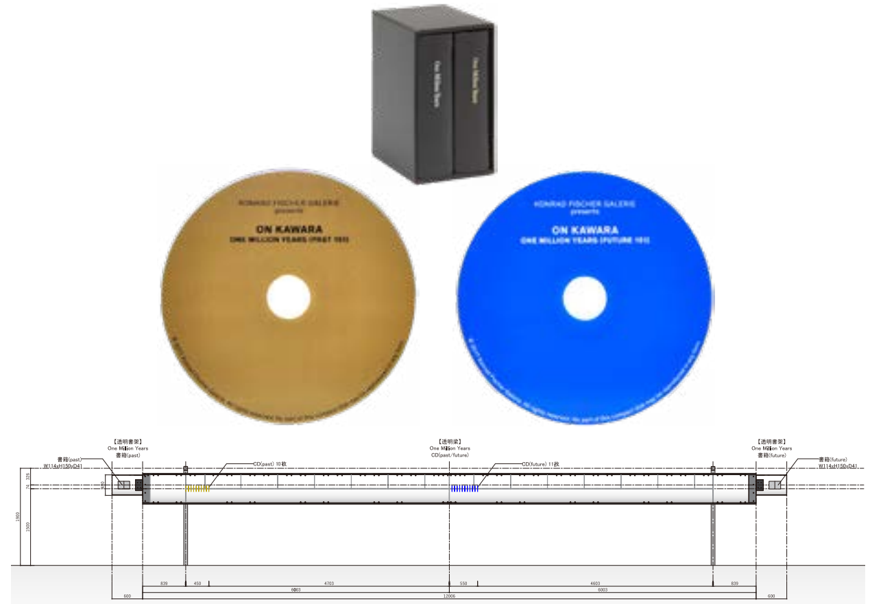
設計：青木淳建築設計事務所 施工：ビーファクトリー 展示：東京スタデオ

多摩美術大学図書館に新たに設置される透明梁 近づくとも過去と未来 200 万年の年号を読み継ごうとする声が聴こえる