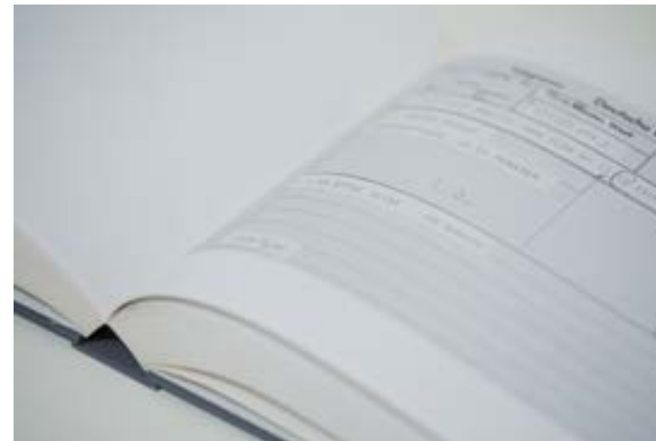
《I AM STILL ALIVE》1978