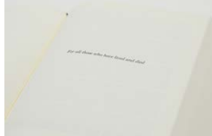
《ONE MILLION YEARS》1999

多摩美術大学図書館は、このたび河原温のブックアート・コレクションを創設します。 《TODAY》シリーズはじめ、《I AM STILL ALIVE》《ONE MILLION YEARS》などで世界の美術界を席捲した河原温は、作家としての実像を秘したまま、2014年に逝去します。しかし、その生涯を記述するための資料は、例外的に平出隆（多摩美術大学図書館館長）に託されました。また2019年夏、ニューヨークの河原温財団から、本学における研究環境と資料収集の状況、《言語と美術 — 平出隆と美術家たち》展（DIC川村記念美術館 2018-19）などが評価され、コレクションの完全化へのご協力をいただき、河原温自身がひそかに指定していた32冊の Important Books がすべて揃った世界的にも稀れなコレクションの実現となりました。 ここに河原温ブックアート・コレクション創設記念展が、本学アートテークにて開催される次第です。また、伊東豊雄設計の図書館の一隅には、《言語と美術》展のために青木淳が設計した、宙にかかる12メートルの「透明梁」が設置されます。その中に積層されるCDから、人類の連鎖する声を形象化する、河原温の貴重で壮大な書物《ONE MILLION YEARS》の響きが聴こえてきます。